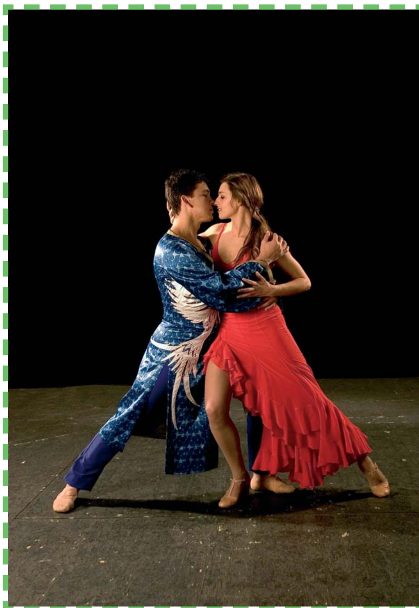
El Teatro Apolo recibe la recreación de la historia de Wallada , una joven que elige una existencia intensa y rebelde en la Córdoba Omeya.