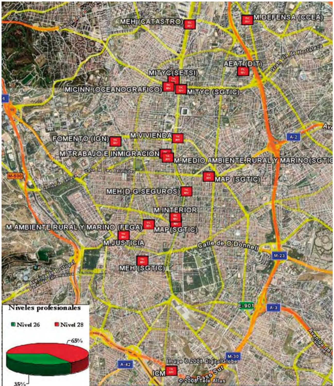
FIGURA 2. Distribución actual de destinos de los integrantes de la Promoción