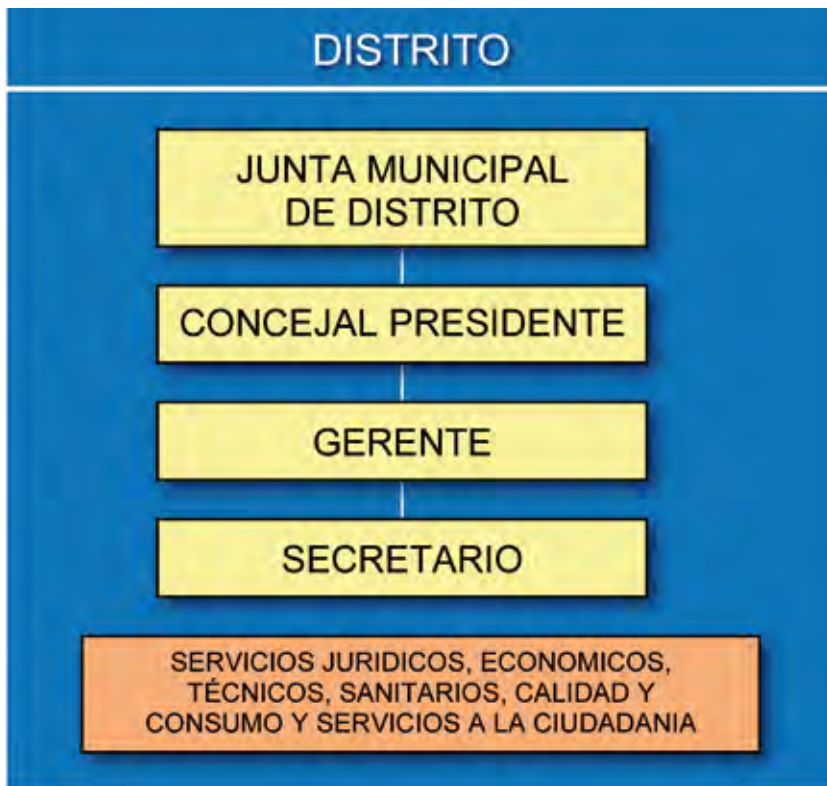
FIGURA 3. Estructura de los distritos