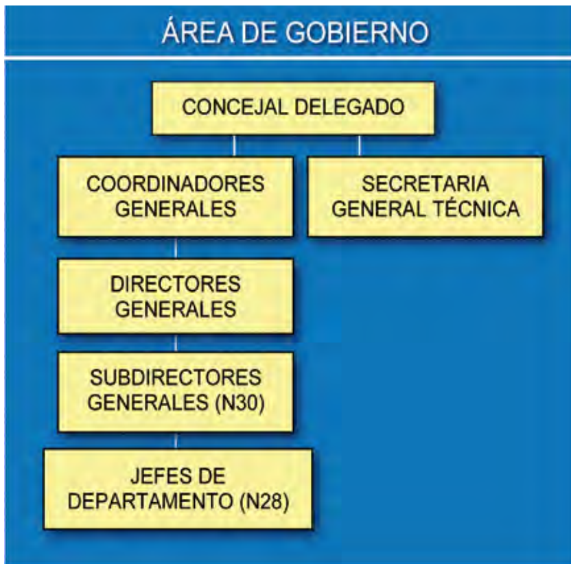
FIGURA 2. Estructura de las diferentes áreas de Gobierno

mía y Empleo (Dirección General de Innovación y Tecnología).